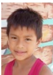
Hernalou, 9 jaar groep 6 basisschool